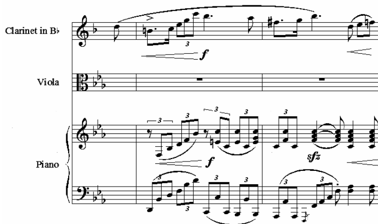
Exemplu: motivul M5, măsurile 34/4 – 35/4

Un alt exemplu este M5 prezentat de clarinet, segmentat și secvențat ascendent (măsurile 34/4 – 35/3), ca și continuarea cu prelucrarea lui M6, tot la clarinet și violă, de asemenea modulant.