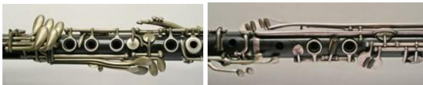
Două detalii de construcție ale unor clarinete în Si bemol, cu 20 de clape, având system Boehm, construite de firma Buffet Crampon la Paris după 1930.

Munca instrumentiștilor pentru realizarea acestor opt piese necesită timp de lucru îndelungat. Este de dorit să existe între interpreți o clară înțelegere și o eficiență coordonare, precum și o unitate de vederi comună asupra dramaturgiei ciclului.