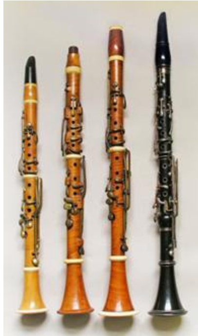
Cele patru clarinete prezentate mai sus aparțin unor perioade diferite. Ele au fost așezate în ordinea tonalităților și a dimensiunilor. Primul a fost construit la 1840, al doilea la 1860, al treilea în 1845, iar ultimul, din abanos, a apărut în 1827.