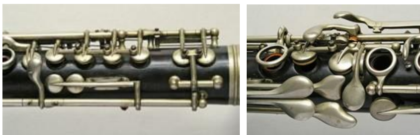
Fragmente dintr-un clarinet în Si bemol, sistem Romero, construit de firma P. Bié din Paris după 1865, aflat în colecția Universității din Edinburg, Anglia.

Coda care termină arcul trioului devine climaxul plin de energie al ciclului. Se reia motivul 3, al luptei, în deplasare ascendentă din registrul grav spre mediu la pian, însoțind cadența clarinetului și violei. Zona modală oscilează bivalent, oferind ca alternative inflexiunea Si bemol major-sol minor și apoi Si bemol major-Mi bemol major . Motivul 4, asimilat cu ceata davidienilor s-a lărgit progresiv prin masivitatea acordică a pianului și a celorlalte instrumente exprimând o desfășurare apoteotică de forțe, de energie. La chemarea celulei-semnal repetată de conglomeratele placate ale vocilor răspunde motivul 9 (87/4-89/1) victorios. A doua repetare a celulei-semnal este urmată de motivul 1 (măsurile 89/3-91/3) cu același caracter învingător, exprimat de clarinet, violă și vocile medii ale pianului, în timp ce vocile sale grave intonează motivul 9. Cadența finală folosește sexta napolitană în cadrul unei structuri clasice: I6/4 – V7/6+ – I5, în Si bemol major . Constatăm că în acest ultim segment compozitorul face o recapitulare a principalelor motive apărute de-a lungul piesei.