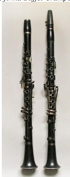
Clarinete care au aparținut virtuozului Reginald Kell, construite pe system Boehm de firma Hawkes & Son în 1925, aflate în Colecția Universității din Edinburg