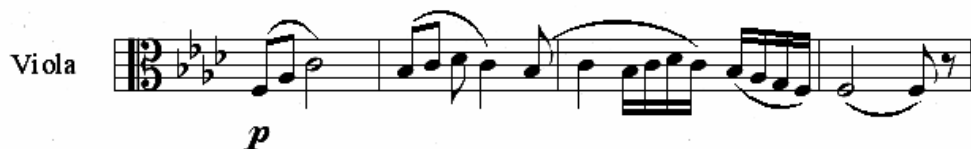
Exemplu: tema Aa, violă, măsurile 4 – 7

În secțiunea Aa-Ab figurile ritmice evidențiază construcții individualizate. În primul segment, Aa, ele sunt executate într-un autentic stil parlando rubato , uneori monodic, deoarece compozitorul acompaniază rareori melodia violei.