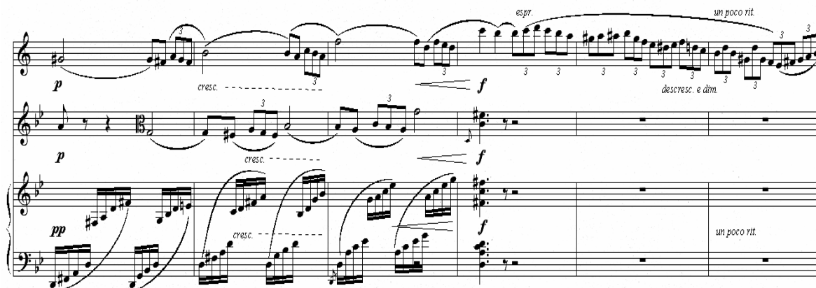
Exemplu: culminația și cadenza clarinetului (cu violă și pian), măsurile 61 – 66

Un fragment, trioletul din M1 constituie celula ce generează cadența clarinetului; dezvoltarea sa creează culminația perioadei B1.